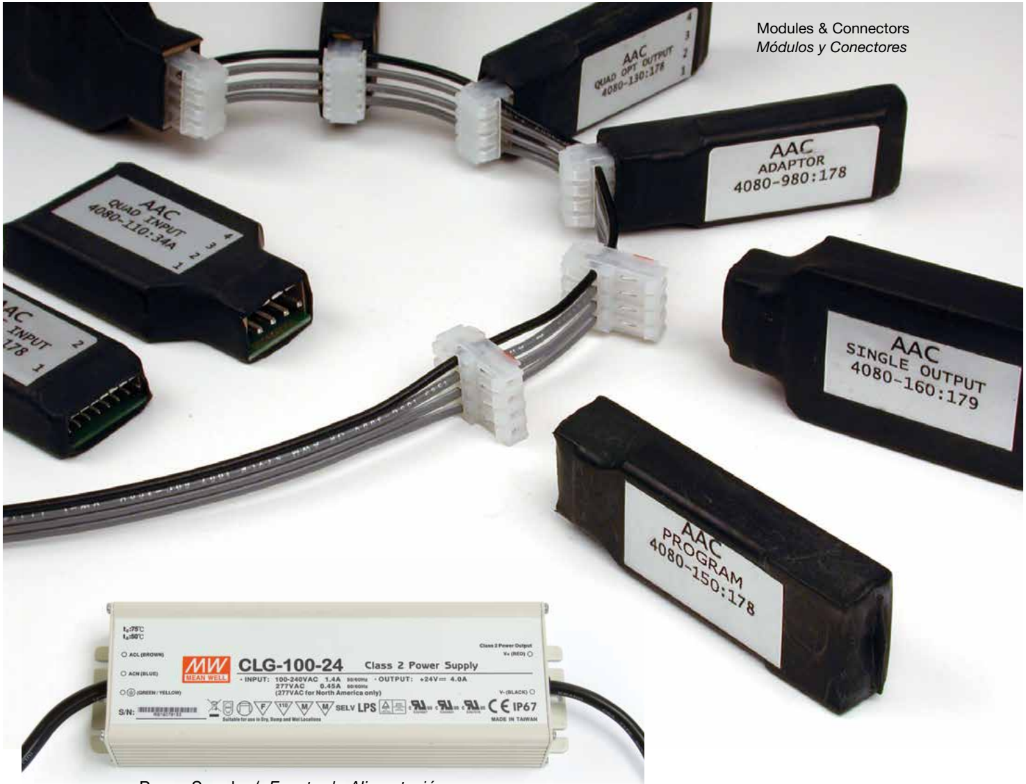
Modules & Connectors Módulos y Conectores