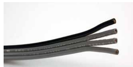
4-Wire Cable Cable de 4 Alambres